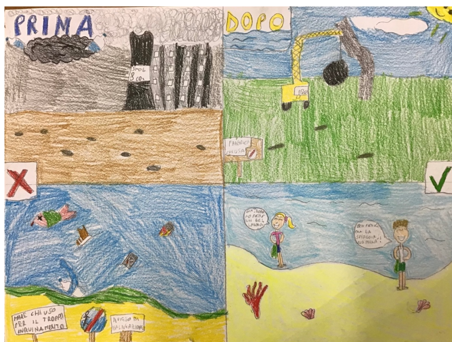
Disegno di Viola

L'inquinamento dell'acqua mette a rischio la salute delle persone, degli animali e delle piante, la produzione di cibo e gli equilibri ambientali. Il suolo può essere inquinato dai pesticidi, dalle discariche, dagli scarichi industriali o dalla crescita eccessiva delle città.