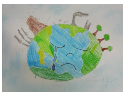
Disegno di Emma

sono gli scarichi delle industrie, i pesticidi usati in agricoltura e gli scarichi domestici.